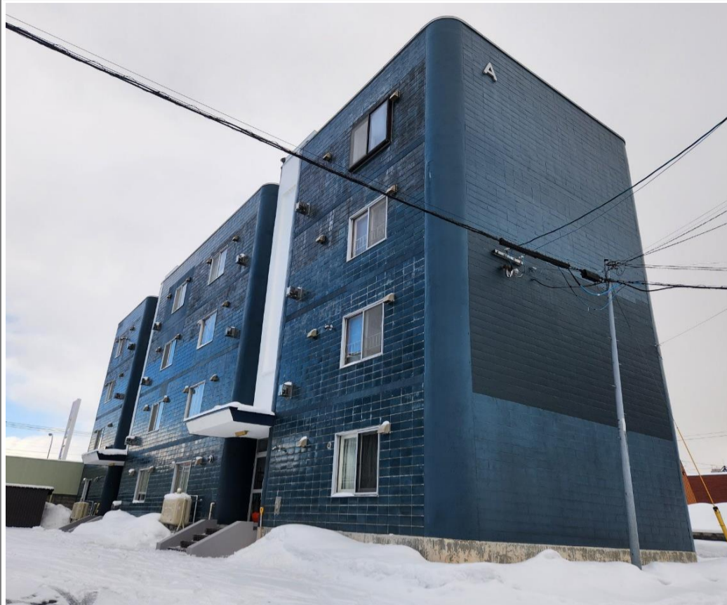
区分所有物件 セラコーポA棟 1階 102号室