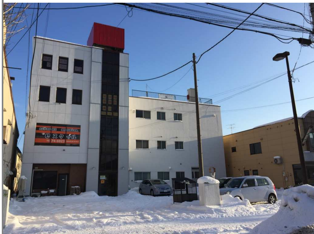
国道40号線沿い・RC造収益物件・満室時収益率19%